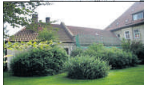
Vorher – nachher: Im linken Bild der Blick auf den Südflügel, wie er sich heute präsentiert, im großen Bild die Simulation des fertigen Neubaus.