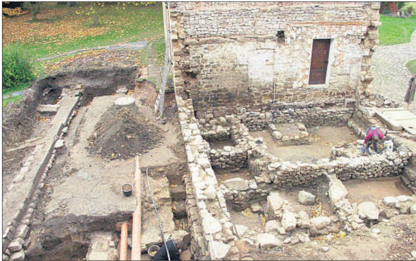
Eintauchen in die Geschichte: Ganz links die Mauer des alten Klostergangs; links neben den modernen Rohren ein alter gemauerter Frischwasserkanal. Rechterhand die bereits komplett freigelegten und gesäuberten Mauerreste der Kellerräume, die vermutlich aus dem 18. Jahrhundert stammen.