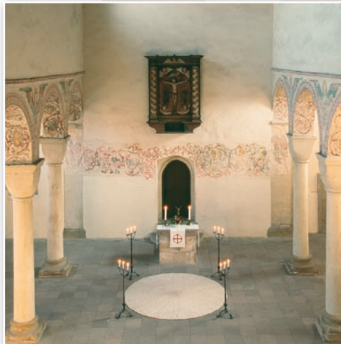
..... Die Westkirche und Impressionen aus der „Oase“ .....